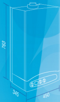
ECO 3 280 Fi