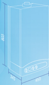
ECO 3 280 i